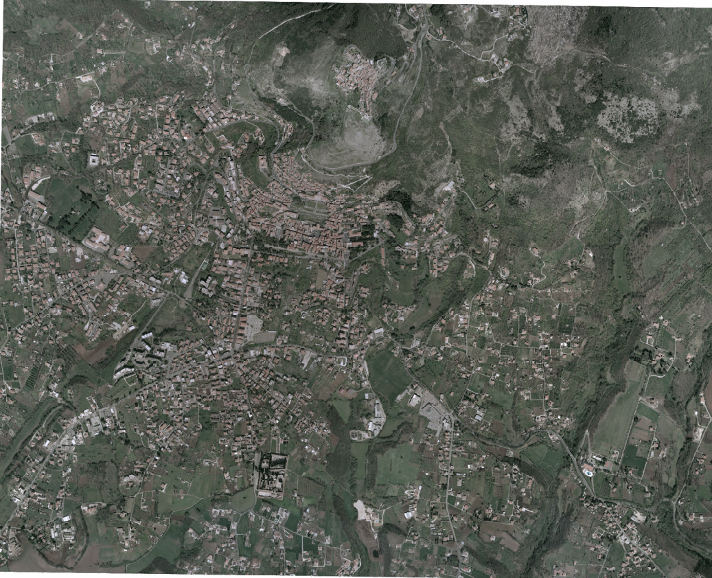
ORTOFOTO Scala 1 : 25000

Volo del 2002 di proprietà della Regione Lazio Restituzione del 2005